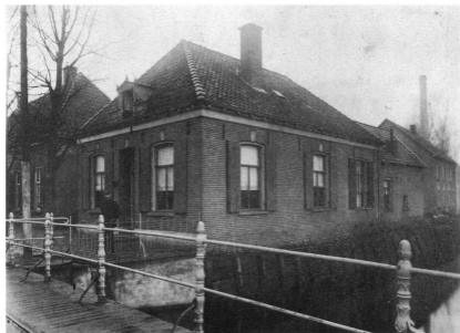
De oude leerlooierij met op de voorgrond de Peppelbrug, die in mei 1940 opgeblazen is.