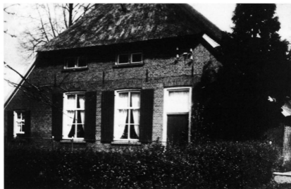
Boerderij „de Bogelaar”

Men zegt wel eens dat een misdadiger steeds op de plek van het misdrijf terugkomt. Dat klopte ook in dit geval, want na de bevrijding is deze bewuste man nog weer bij Pardijs geweest om aardappels te halen. Men wist toen bij Pardijs nog