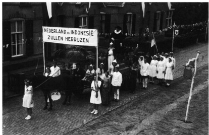
Foto augustus 1945. Optocht Stationsweg.

Welke gebreken de BS overigens ook gehad moge hebben, het is gelukkig dat zij er geweest is. Een „Bijltesdag” is door haar optreden voorkomen. Dat zullen ook de NSB-ers hebben moeten toegeven.